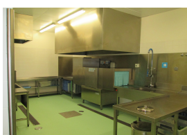
Lavagem de loiça