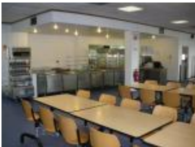
Ref. n.º 29 - Instituto Tecnológico e Nuclear (ITN) – Sacavém (2010)