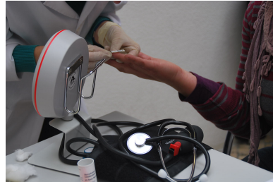
Avaliação do risco cardiovascular - Sede dos SSAP