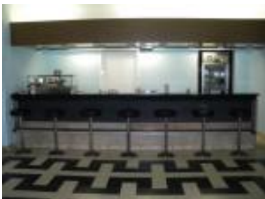
Bar do Refeitório

Está em curso a renovação total do Refeitório n.º19 (SSAP – Av. Duque d'Ávila - Lisboa).