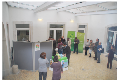
Avaliação do risco cardiovascular - Sede dos SSAP

Ref. n.º7 – Instituto Nacional de Saúde Dr. Ricardo Jorge (INSA) – Lisboa (2010)