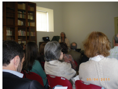
Palestra "Gestão do Stress"