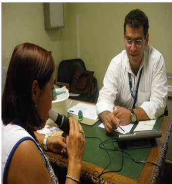
Rastreo da Função Respiratória no INE

Impulsionados pelo sucesso destas iniciativas e pela evidência dos seus benefícios, pretendemos continuar a promover estas atividades, de caráter preventivo.